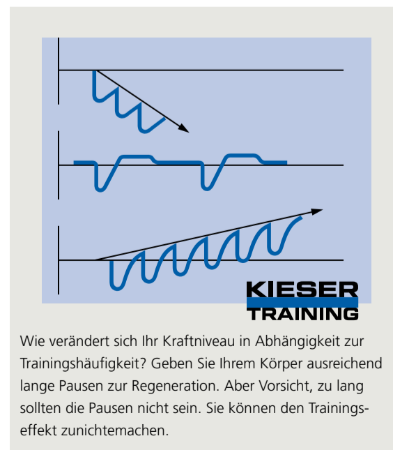
Wie verändert sich Ihr Kraftniveau in Abhängigkeit zur Trainingshäufigkeit? Geben Sie Ihrem Körper ausreichend lange Pausen zur Regeneration. Aber Vorsicht, zu lang sollten die Pausen nicht sein. Sie können den Trainingseffekt zunichtemachen.

Tage. Denken Sie immer daran, dass Sie nicht während des Trainings, sondern in der Erholungsphase stärker werden.